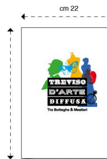
C. Cartellina stampa