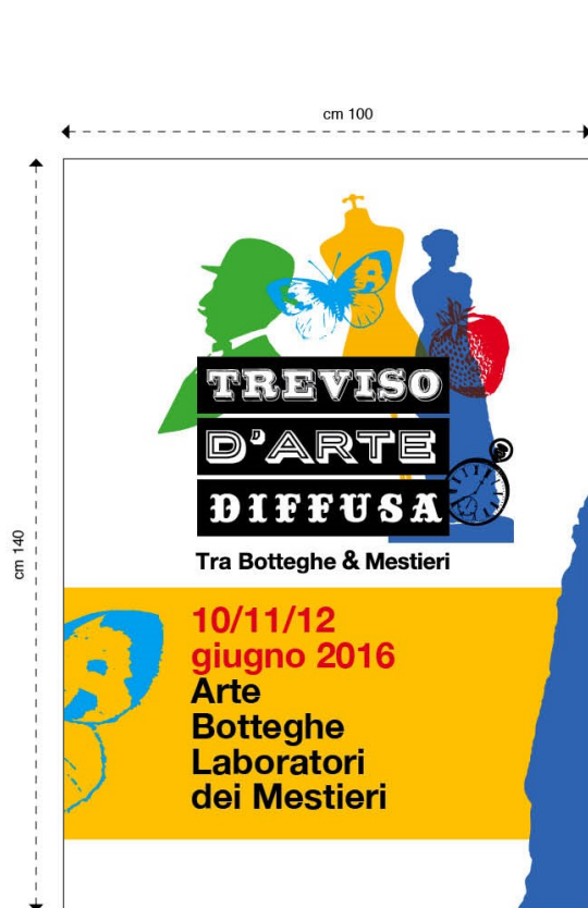
A. Manifesto affissione