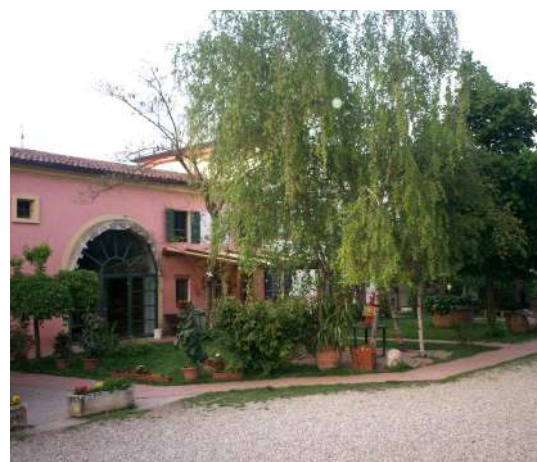
La Vecchia Fattoria, agriturismo didattico

CONTATTACI PER PARTECIPARE AL PROGRAMMA "ERASMUS PER GIOVANI IMPRENDITORI"