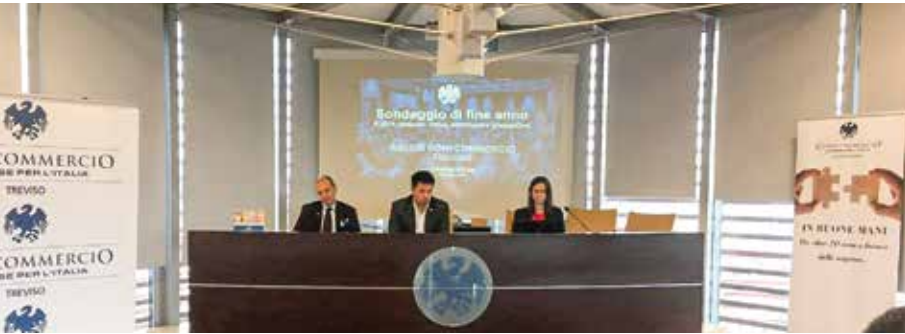
Presentazione Sondaggio 20 dicembre 2019

da leggere, c'è ancora in realtà un grande margine di autonomia e manovra in cui ognuno di noi può prendere spunto e nuove energie per aprire una nuova attività, rinnovare quella esistente o semplicemente introdurre nuovi prodotti e nuovi servizi”.