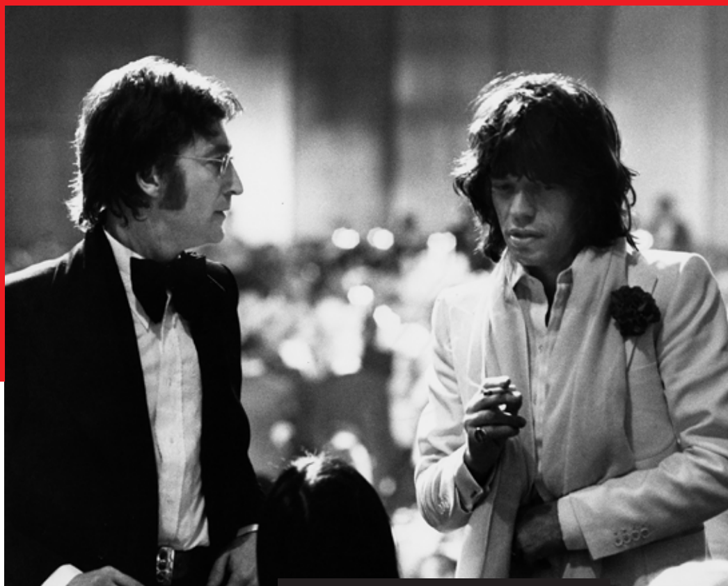
JOHN LENNON E MICK JAGGER

Foto di DAVID BOWIE - MADONNA - MICHAEL JACKSON - CHER - ALICE COOPER - FRANK ZAPPA - BARBRA STREISAND - LIZA MINNELLI - BRUCE SPRINGSTEEN - DIANA ROSS - BOB DYLAN - ELVIS PRESLEY - FRANK SINATRA - RINGO STARR - ELTON JOHN - PAUL MCCARTNEY - SIMON AND GARFUNKEL