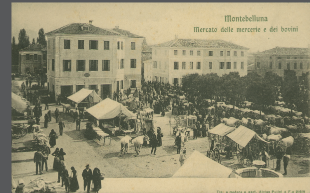
Il mercato dei buoi e dei cavalli di Piazza Negrelli

Montebelluna, importante immagine storica che mostra la fase iniziale di riordino urbanistico che ha condotto allo spostamento del mercato dal colle al piano. In questa veduta il sistema geometrico delle quattro piazze, progettate dall'ing. Dall'Armi, (Petrarca, Marconi D'Annunzio e Negrelli) è appena abbozzato e spiccano nello spazio aperto sia il municipio che il nuovo edificio, la Loggia dei grani, ancora in parte coperto dalle impalcature. 1872