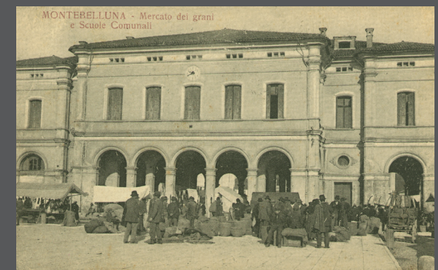
Il Nuovo Mercato, piazza Marconi durante il mercato dei grani lungo i lati della Loggia. Si possono osservare i sacchi di sementi a terra e alcuni uomini in fase di contrattazione. 1925